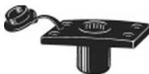
Крепление под отверстие No.244