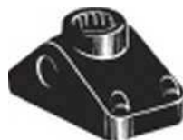
Универсальное крепление No.241

логотипом "Scotty" вверх. Для крепления под отверстие No.244 в месте установки следует просверлить отверстие диаметром 35мм. (креплёж для крепления в комплект поставки не входит).